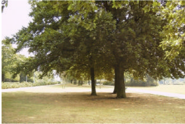
onderdeel 1 De aanleg