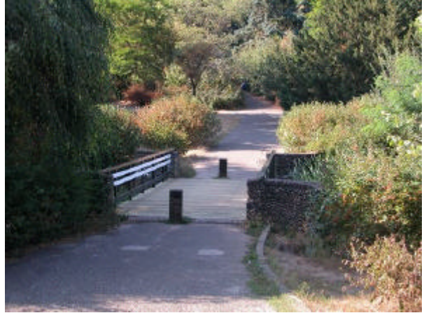
onderdeel 5 Brug