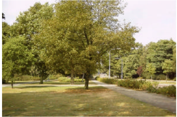
onderdeel 1 De aanleg