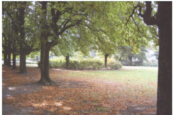
onderdeel 1 De aanleg