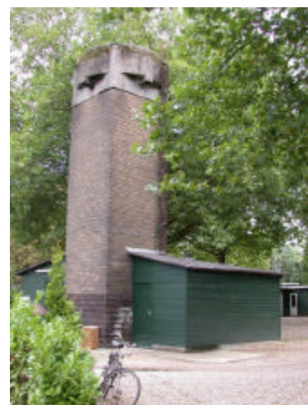
onderdeel 9 Watertoren