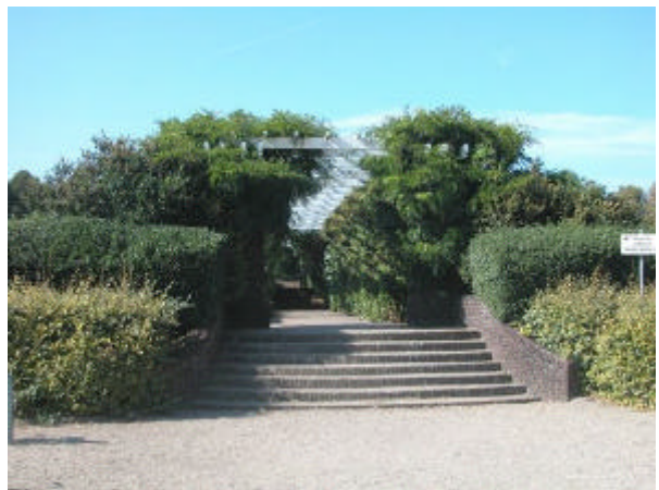
onderdeel 3 Pergola bij Rosarium