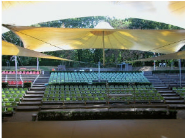
onderdeel 6 Openluchttheater