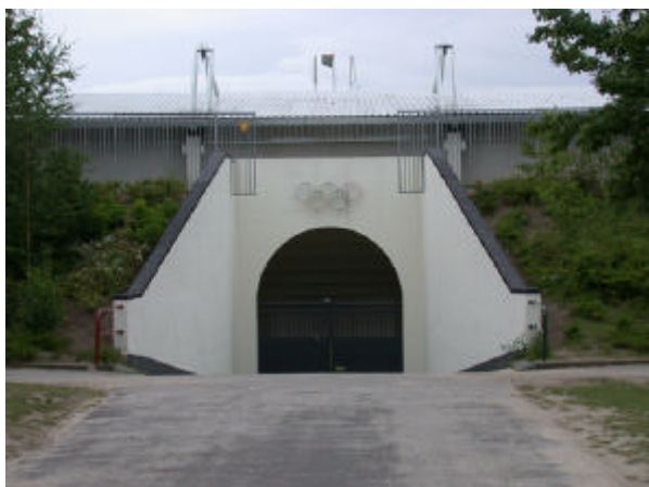
onderdeel 8 Stadion