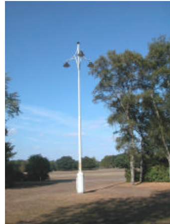
onderdeel 7 Lantaarnpaal