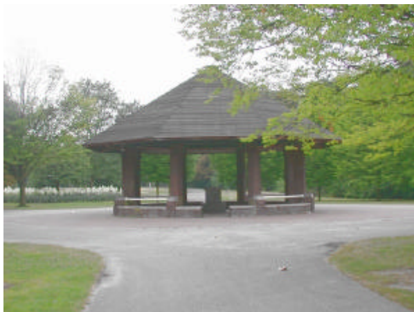
onderdeel 2 Schuilkoepel