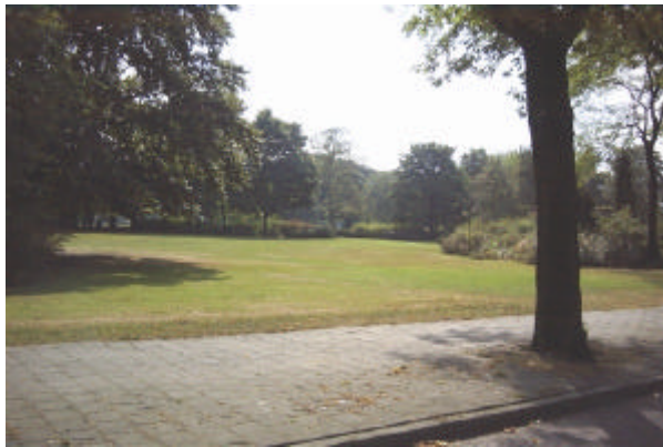
onderdeel 1 De aanleg