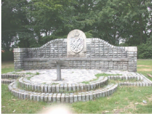
onderdeel 4 Bank